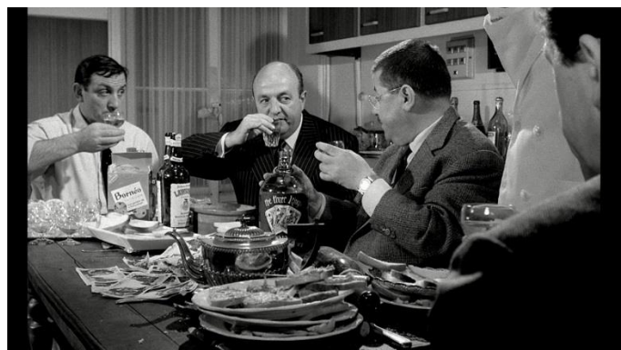
(Abschnitt aus dem Film " Mein Onkel, der Gangster ")

Der Film von Michel Audiard ist über 50 Jahre später immer noch "die hysterisch komische Parodie eines Gangsterfilms mit verrückten Dialogen und unumgänglichen Zitaten, nach allen Regeln der Filmkunst "Qualité française" der 60 Jahre (Carné, Autant-Lara, Clouzot): "mettre des bons mots dans la bouche de bons comédiens" (Gute Dialoge und gute Schauspieler)". Ob die Winzervereinigung, um welche es sich im vorliegenden Bericht handelt, den gleichen, trockenen Humor der schwarzen Gangsterkomödie hat, ist hier nebensächlich. Stattdessen streben die 35 Weingüter der Tontons Trinqueurs danach, ihren gemeinsamen Nenner zum Vorschein zu bringen: Ihr Know-how im naturbewussten -spricht biologisch, ja sogar biodynamischen Weinbau weiterpflegen, teilen und übermitteln und vor allem zeigen, dass eine Verkostung kein pedantischer Anlass sein