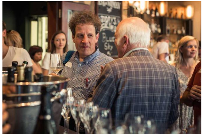
Zwei bekannte Schweizer Gäste