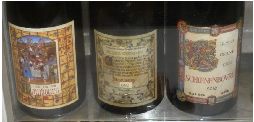
Die drei Grands Crus der Domaine: Mambourg, Altenberg de Bergheim und Schoenenbourg

Dieser Wein kostet zwischen 19.- und 19.80 in der Schweiz , darunter bei Cavesa , Baur au Lac und Farmy . In Deutschland kostet er €15.95 bei Vinopolis .