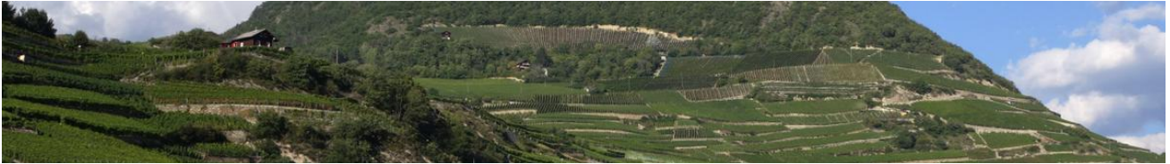
Der Weinberg von Saint Léonard, wo Electus seinen Hauptsitz hat