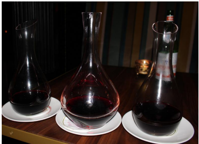
Die drei Weine der ersten Serie

Die Weine der Domaine werden durch Cavino in die Schweiz importiert. Der Jahrgang 2003 der Gravières kostet 58.-. In Deutschland sind sie nicht erhältlich.