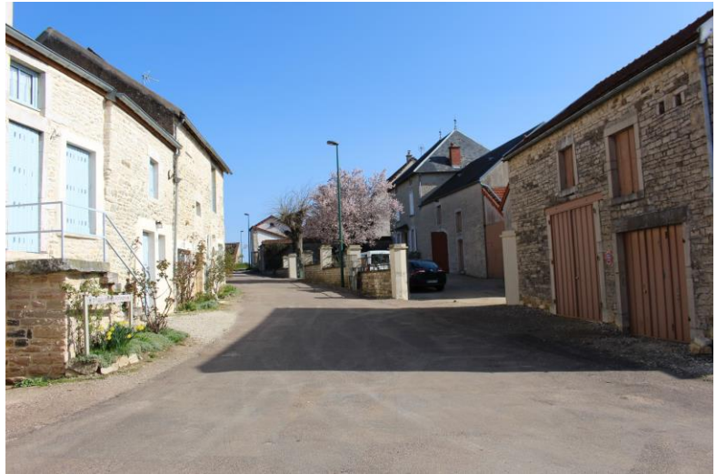
Die Domaine ist im Hintergrund auf der rechten Seite

(avv+jfg): Leuchtendes Rubinrot, schöner Glanz. Intensive, noch etwas vom Holz geprägte Nase, rote Kirschen, Himbeeren dann aber auch exquisite Brombeeren, dahinter rauchige Noten, sehr gute Komplexität, welche sich weiter entwickeln wird. Am Gaumen weicher Auftakt, sehr satte und ungemein lebhaft frucht, weiche, samtige Tannine streicheln die Zunge, die Frucht wird vom Gerbstoff und einer gut integrierten Säure getragen. Schöner Schmelz, ohne jegliche Schwere, neben roten Kirschen