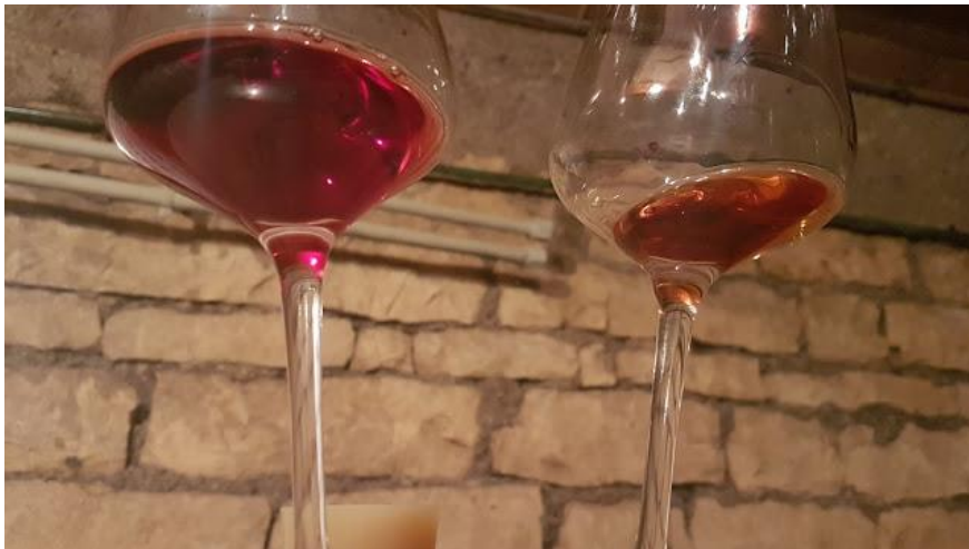
v.l.n.r.: Der Pommard Les Vignots 2014 und der Pommard 1967